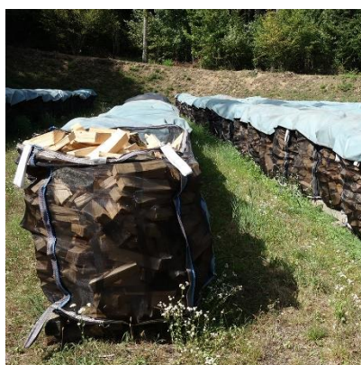
Stère en big-bag sec scié à 50 cm