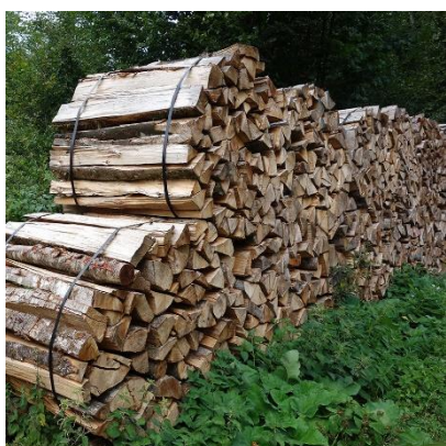
Stère en ballot en bûches de 1 m.