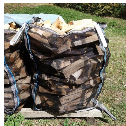
Stère en big-bag sec scié à 33 cm